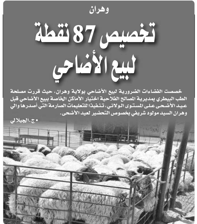
في هذا الإطار...

حسب عدد من الأطباء البيطريين، فإن هذه التعليم من شأنها أن تمكن المواطنين من شراء أضحية سليمة تماماً من مختلف الأمراض، بالتالي تتمكن مختلف الأسر من قضاء عيد في ظروف صحية جيدة، تتفادى من خلاله مختلف الأمراض التي عرفتها العديد من العائلات الجزائرية خلال العامين الماضيين، إذ لوحظ تغف الأضاحي رغم وضع لحومها في الثلاجات واحترام مختلف درجات الحرارة التي ينصح بها الأطباء البيطرية.