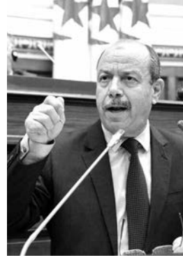
التزوير يعرفهم الشعب، متأسفاً "لخوض أشغال الانتخابات الكاملة في ممارسة مصالح معينة وحرص آخرين على خدمة البلاد".

كما أثنى الوزير مطولاً على الدور الذي لعبه الجيش ولا يزال من أجل إعادة الكلمة للشعب وحماية المؤسسات واستقرارها في محيط إقليمي جد مضطرب، مستشهداً بما تعرضت له العديد من الدول التي كانت تعتقد أنها في منأى عما تعيشه اليوم من حروب واضطرابات.