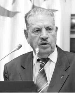
بموجبها الرئيس المستقيل.

وتوقف قوجيل، ليضمن الدور الكبير للجيش بعد احتيازه لخيار الشعب، مشيراً إلى أن أهم شيء اليوم هو الذهاب إلى انتخابات رئاسية من أجل إعادة بناء المؤسسات والحفاظ على استقرار البلاد.