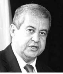
دعوة رجال الإعلام إلى اعتماد الخطاب المسؤول

أكد وزير الاتصال الناطق باسم الحكومة ووزير الثقافة بالنيابة، حسن راجبي أن الصحفيين "لا يهانون" لأن عملهم نبيل وإنساني، مشيراً إلى أن من مهام الصحفي التدقيق وتغطية الأحداث الجارية، مبرزا أن قطاعه بصدد إعداد إطار قانوني يكون عند مستوى تطلعات منسبته سواء في القطاعين العمومي أو الخاص.