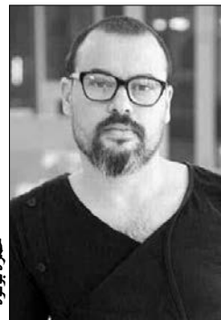
دعوتهم سابقا للمشاركة في "بينالي فينيسيا" وعرضوا أعمالهم بجناح الجزائر.

ودعا بونوة الفنانين والمثقفين الجزائريين إلى الحذر من المشاركة في مثل هذه الفعاليات التي تستغل الفن للتدخل في الشؤون الداخلية للبلاد. وتابع يقول بخصوص الدعوة الموجهة إليه، إنه يرفض بشكل قطعي كل النقاشات والندوات خارج بلاده للحديث عن الحراك السلمي وأوضاع الجزائر بصورة عامة، وأكد أنه يرفض كل أشكال المشاركة خارج بلاده في أحداث فنية أو ثقافية تتطرق أو تلمح أو ترمز للحراك الجزائري. وقدم بونوة اعتذارا للمعهد، مبديا عدم المشاركة في رسالة إلكترونية،