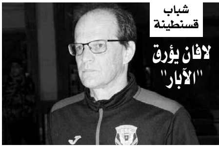
شباب قسنطينة لا فان يؤرق "الأبار"

وينجم عن ذلك تأجيل المباراة بين اتحاد العاصمة والجار مولودية الجزائر، وهو الحجة التي يسعى مسؤولو الاتحاد