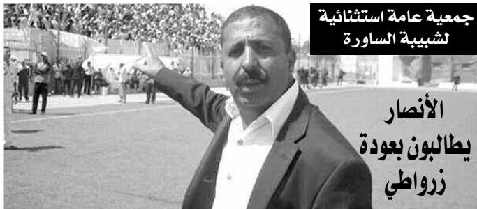
جمعية عامة استثنائية لشبيبة الساوره

وأوضح المدرب في اتصال هاتفي بوكالة الأنباء الجزائرية أن الوفد المتتقل إلى إسبانيا يضم 12 لاعبا سيدخلون المنافسة في العاشر من شهر أكتوبر، حيث أسفرت عملية القرعة على وقوع الفريق المدرسي الجيجلي ضمن المجموعة (د) التي تضم كل من الولايات المتحدة الأمريكية وأندورا وألمانيا وسويسرا.