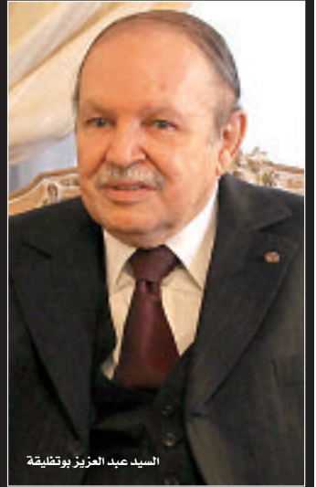
السيد عبد العزيز بوتفليقة