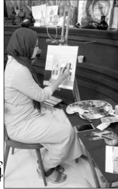
صورة في: لحن