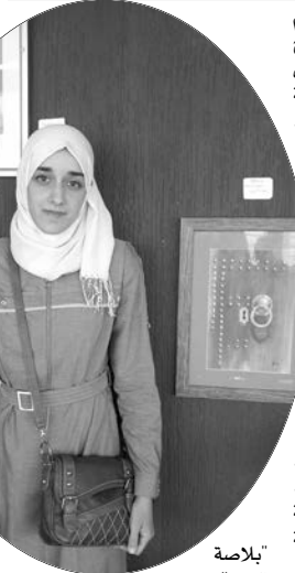
صورة في: لحن

أضاف أمام الحضور، أن الصور المعروضة بهذه المناسبة، هي حول ساحة التوت من الفترة العثمانية إلى مرحلة الاستعمار الفرنسي، ونشأتها كانت بغرس نخلة، ومن ثمة تم تشييد العديد من البنايات الرسمية وغير الرسمية المهمة حولها، مثل مسجد "موغان" التي تعتبر أقدم وأكبر مطبعة على مستوى شمال إفريقيا، صدرت عنها جريدة "الثلث"، كما أن هذه المساحة كانت تحتضن جميع النشاطات الاجتماعية والثقافية للمنطقة، وقد عرفت سنة 1986 غرس أشجار التوت، اعتقادا أن اسم الساحة يعود إلى فاكهة التوت.