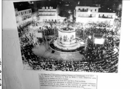
صورة في: لحن