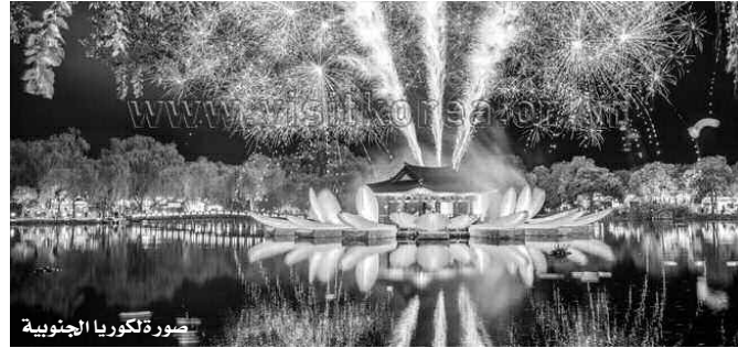
صورة لكوريا الجنوبية