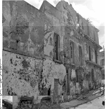
عائلات تعيش مخاطر السكن داخل هذه العائلات

وبخصوص قطاع الرياضة، ذكر المسؤول أنه سيتم إعادة بناء ملعب جوارى بحي "ليستورال"، وتم تخصيص قيمة مالية معتبرة للمشروع حددت بـ 10 ملايين سنتيم، سيتم إعادة تهيئته نهائيا وسيزود بالمشب الاصطناعي وتوسيع المدرجات وكذا غرف تغيير الملابس وإعادة تهيئة ملعبين جواريين آخرين هما في حالة مهملة يتواجدان بكل من حي سيدي وحي الأجنحة، سيزودان بالمشب وكافة المستلزمات الضرورية.