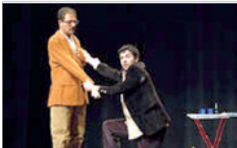
لقطة من المسرحية

تجسدت أخيرا فكرة إقامة الأيام المسرحية الأولى بالمعهد العالي للفنون المسرحية بمعهد برج الكيفان، التي افتتحت أول أمس بإشراف وزيرة الثقافة السيدة خليدة تومي، حيث سطر برنامج شري يحظى بالسحر في يومه العالمي المصادف 27 مارس.