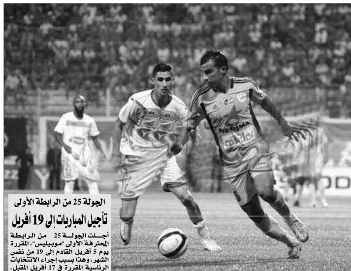
الرجولة 25 من الرابطة الأولى تأجيل المباريات إلى 19 أبريل

اقترب فريق اتحاد الجزائر من التتويج باللقب الوطني موسم 2013-2014، بتعميقه الفارق عن أقرب ملاحقيه ب11 نقطة كاملة، إثر فوزه في الجولة 24 من بطولة الرابعة الأولى المحترفة لكرة القدم، على أولمبي الشلف بهدفين مقابل صفر.