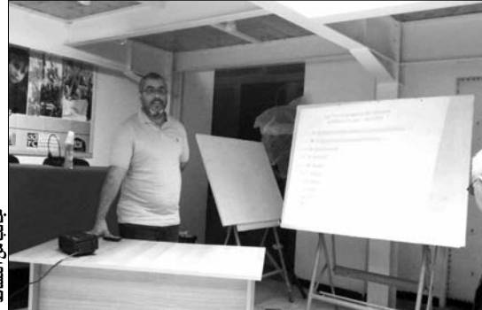
أحد المشاهد من المحاضرة