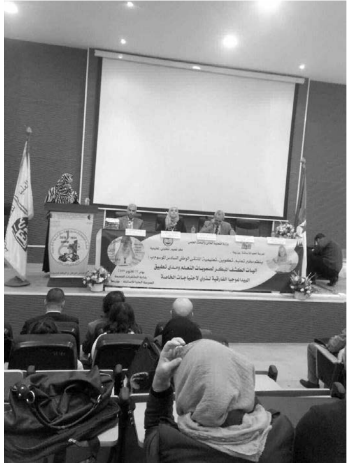
تعليمات الوزارة الوصية.

من جهة أخرى، أوضحت محدثتنا أن الحديث عن مدى وجود عائلات تولى أهمية للصعوبات التي يعاني منها الأبناء، في غياب الإحصائيات أو دراسة واضحة، يقودنا إلى البحث فيما إذا كانت بعض الشروط متوفرة فيهم، ومنها وجود فكرة التثقل للابن كيف ما كان، التحلي بروح المسؤولية والتضحية، وهذه الشروط، حسبها، لا تتوفر في كل العائلات، وهو ما يصعب من عملية الحد من صعوبات التعلم.