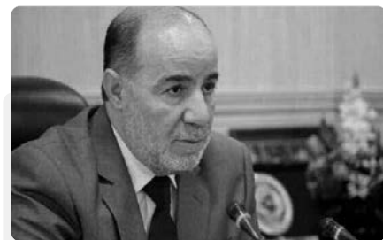
وزير الشؤون الدينية؛