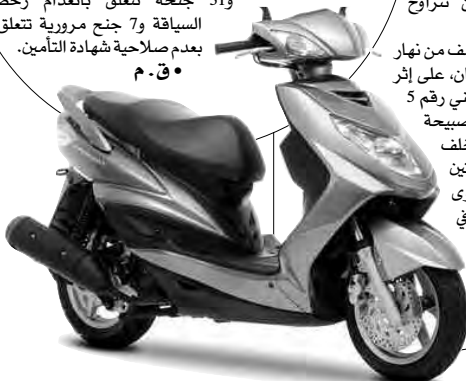
• ع.ف. الزهراء