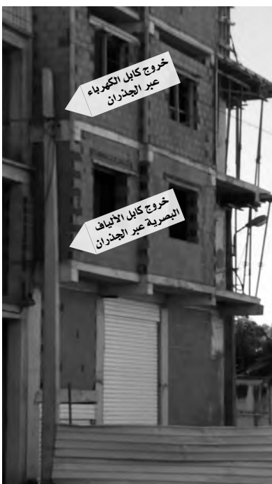
خروج كابل الألياف البصرية عبر الجدران

مشاكل الحي تعود إلى غياب المصالح الساهرة على حماية الملك العام والمحيط العمراني، فاهترا الطريق ودكت الشاحنات المقطورة ونصف المقطورة لتقلها، الأسفلت الذي وضع على عجل فوق طبقة رقيقة من الردم، ويكاد هذا الدك