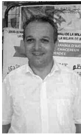
هل هو نداء توجهونه لكل من يقرأ هذا؟

●● نعم، والنداء هنا موجه للجميع من عمال الصحة: أطباء ومحسنين ورجال أعمال وغيرهم، سواء أكان ذلك في عملية التكفل الطبي أو مرافقة المرضى أو في الوقاية والتحسيس. فكل مساعدة مرحب بها، لاسيما أن الهدف التخفيف عن المرضى. التكفل بالأمراض المزمنة، خصوصت له استراتيجيات وبرامج هامة، ولكن ذلك لم يكبح أمر انتشارها؛ ما أسباب ذلك حسبكم؟ ●● انتشار الأمراض المزمنة أو الثقيلة مثل الأمراض القلبية وارتفاع الضغط والسكري والسرطان، في تزايد مطرد بالمجتمع، وهذا واقع. ومن هذه الأمراض ما أعد بشأنها دراسات وبائية، وأخرى هي بحاجة إلى هذه الدراسات الوبائية لمعرفة خصائص انتشارها بمجتمعاتنا، والإطلاع أكثر على عوامل الخطر والإصابة، وأيضا معرفة تواجدها بالضبط، والوصول إلى وضع برنامج عمل للتصدي لانتشارها، وهذا معروف ومأخوذ به، ولكن المهم بين هذا وذاك هو التنسيق بين مختلف القطاعات لإجراء هذه الدراسات، وكذا تطبيقها على أرض الواقع؛ فالجزائر تتوفر على كل الوسائل من أجل إجراء هذه الدراسات، هناك عمل ميداني يجري في هذا المجال، ولكن يبقى غير كاف، ولا بد من تقويته مستقبلا. يقال في الطب إن الوقاية تبقى خير علاج؛ ما تعليقكم خاصة في ما تعلق بالأمراض الثقيلة؟