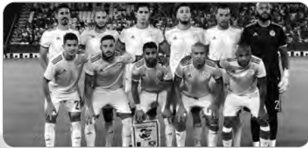
النهائي أمام الجزائر- المرتبة الثانية في ترتيب سنة 2019 للمنتخبات الإفريقية، متبوعاً بالمنتخب النيجيري صاحب المركز الثالث، ق - ر.

والسينغال منافسان للجزائر، وسيتم التعرف على الترتيب في 7 جواني المقبل. يحتل المنتخب السنغالي -اللقب الثاني-