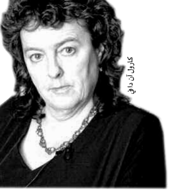
كارول أن داف

وقرأت شاعرة البلاط قصيدتها "صلاة" خلال تظاهرة نظمها أحد أمم السجناء، حيث أعلنت أن قرار الحكومة في منع إرسال الكتب إلى السجناء يهدد "روح البلد"، وأكدت "أن قيم الخيال، التعاطف، التسامح والرحمة التي تميز بلدنا مهددة بالضيق.... وأن من ليس لديهم شيء، تقول لهم هذه الحكومة بأنهم يملكون الآن