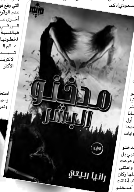
استخدما بسهولة وتعرف

كما أشارت أن روايتها (مدخنو البشر) ليست مولودها الأدبي بل هي والدها الأدبي، فقد ترعرعت حروفها على أرض أوراقها واعتنى بأفكارها المبعثرة ولم شملها وكان سنداً لقلبي وقت ضعفه، وقد أطلقت على والدها الأدبي اسم "مدخنو"