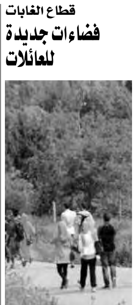
باشرت مصالح محافظة الغابات بولاية وهران، في الفترة الأخيرة، حملة تهيئة العديد من الغابات، بهدف توفير فضاءات للأنشطة تفضل التوجه إلى هذه الأماكن، بدل الشواطئ، فيما تخرز ولاية وهران بمواقع طبيعية خلابة على امتداد 150 كلم، انطلاقاً من مرسى الحجاج بالجهة الشرقية إلى حدود ولاية مستغانم، إلى غاية شاطئتي وغاية مداع بالجهة الغربية المتاخمة لولاية عين تموشنت. ج. جيلالي

والمعروف بأنه أكبر حوض سبخية على المستوى الوطني، يقع على مستوى ثلاث ولايات هي: وهران، عين تموشنت وسبدي بلعباس. كما أنها الدراسة أن التوسع الحضري والعمراني بالمنطقة، وقيام المواطنين بإنجاز الحواجز الاسمنتية تحت الأرض المعروفة بطبيعتها الطينية، أعاق مجرى المياه الجوفية الطبيعي باتجاه السبخة الكبيرة، مما أدى إلى تصاعد المياه التي لم تعثر على منفذ للتسرب نحو السبخة بشكل طبيعي. أكدت المتابعة التقنية في هذا السياق، أن المياه المتصاعدة المسجلة في عدة مناطق، من بينها المناطق المجاورة لمطار وهران الدولي، وجامعة وهران والفضائق المجاورة، ستكون له آثار وخيمة