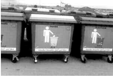
بعدما خصصت لها البلدية 43 مليار سنتيم بداية هذا العام

العمومية، والموجودتين في الاعتبار لبعض التجمعات السكانية، باقي الأحياء السكنية وسجل سكانها، مطالبين في نفس الوقت بالخضراء المتوفرة، أن تعرضت للتآكل لركن المركبات