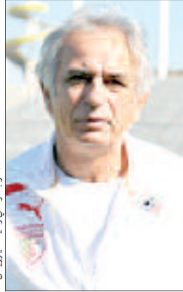
المدرّب الوطني وحيد حليوزيتش