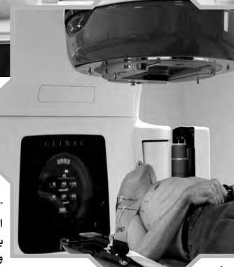
المركز (مصلحة) طلب الأورام ومصلحة العلاج

من جهته، قال رئيس مركز مكافحة السرطان عمار طاباش، إنه يتم التكفل بالمرضى في الوقت المناسب بجمع مصالح