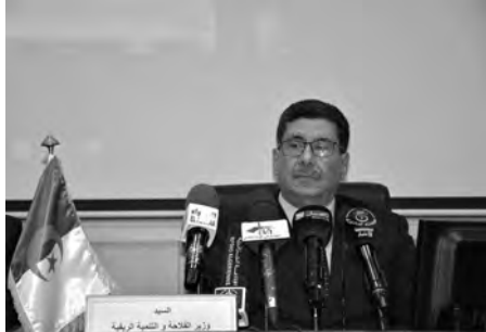
وزير الفلاحة والتنمية الريفية الصلب منذ الفاتح أفريل الماضي