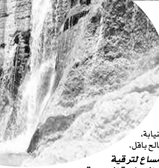
بالنيابة، صالح باقل.