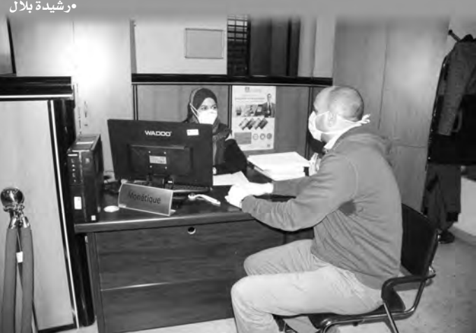
تصوير: ياسين 1

دفع تفشي فيروس كورونا في بعض الولايات بالجزائر، إلى رفع معدل اليقظة الصحية، وهو ما وقفت عليه "المساء" عقب زيارتها لبعض المرافق العمومية الخدمائية، التي تعرف تواجد عدد كبير من المواطنين عليها مثل مكاتب البريد والوكالات البنكية وحتى المحلات التجارية، حيث يادر الموظفون بصورة تلقائية، بوضع القفازات، واستعمال السائل المعقم، بينما راح البعض الآخر من الذين لديهم احتكاك كبير بالمواطنين، إلى وضع الأقنعة كإجراء احترازي، بينما فضل آخرون عدم حمل الأمر على محمل الجد، والاكتفاء بقول: "لن يصيبنا إلا ما كتب الله لنا".