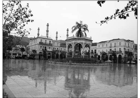
البلدية في أول يوم الحجر

ودائما في إطار حملات دعم المتضررين من الحجر الصحي الشامل تحولت مهام ورشة بولاية المدية إلى فضاء لصناعة وتطهير الكمادات وتوزيعها على سكان البلدية تحديدا وولايات أخرى متضررة. كما قامت سلسلة مطاعم معروفة بمنع 4000 قفاز لمستشفيات بوفاريك وفابور وفرائس قانون بالبلدية، وتم أيضا توفير العديد من التطبيقات للتسوق عن بعد. كما تم تسجيل نفاذ العديد من المواد الغذائية في المحلات مثل الفريضة والدقيق، ليبقى المواطن البلدي في حيرة من أمره خاصة وأنه لا يستطيع التنقل إلى بلدية أخرى لافتائها.