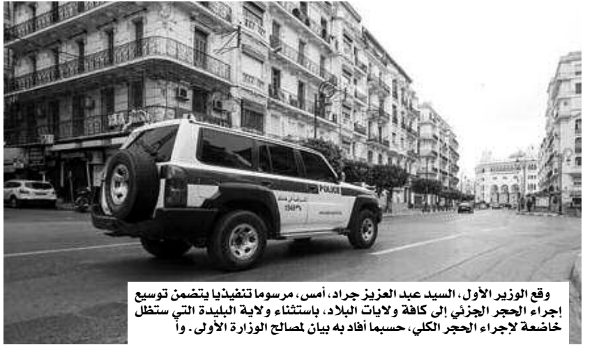
وقع الوزير الأول، السيد عبد العزيز جراد، أمس، مرسوما تنفيذيا يتضمن توسيع إجراء الحجر الجزئي إلى كافة ولايات البلاد، باستثناء ولاية البلدية التي ستظل خاضعة لإجراء الحجر الكلي، حسبما أفاد به بيان لمصالح الوزارة الأولى. وأ

وأوضح المصدر، أنه "عملا بتوجيهات السيد رئيس الجمهورية، ووفقا للمراسيم التنفيذية أرقام 20. 69 و 20. 70 و 20. 72، وكذا الترتيبات التنظيمية التي تمت المبادرة بها من أجل تنفيذها في إطار تدابير الوقاية من انتشار وباء كورونا فيروس "كوفيد-19"، ومكافحته عبر التراب الوطني، اتخذ الوزير الأول، السيد عبد العزيز جراد، اليوم السبت 04 أبريل 2020، مرسوما تنفيذيا يتضمن الأحكام الآتية: توسيع إجراء الحجر الجزئي إلى