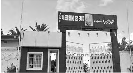
مكعب المزود لحي 3555 مسكنا اجتماعيا بسبدي حماد.