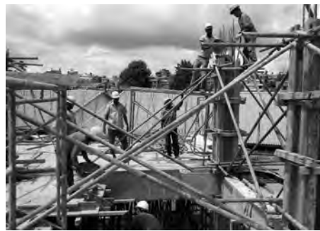
العمل، يرتبط بشكل أساسي بتسهيل السيولة المالية، لكون المقاولات تشهد ظروفًا صعبة نتيجة عن تدابير الوقاية من فيروس كورونا، وأن معظم أرباب العمل استنفذوا ما بحوزتهم من أموال، وليس بوسعهم

تسديد مرتبات العمال وأعباء مؤسساتهم، وأنه يتطلب تمكينهم من الاستفادة من تسهيلات مالية، تعينهم في إعادة بعث النشاط. ومن الضروري، يضيف الخبير معزوز، أن تقوم مؤسسات الإنجاز، إذا استأنفت نشاطها، لضمان الوقاية الصحية، والالتزام بمقاييس التباعد الاجتماعي، بإعادة النظر في مواقيت العمل، بطريقة يتم من خلالها تقسيم العمال إلى فرق متناوبة، لاسيما تلك الورشات التي تتسم بمخافة العمال، مشيرا إلى أن هذه الطريقة ستسمح بتوزيع العمال على الورشات بطريقة ذكية، تخدم مصلحة أرباب العمل من جهة، وتلتزم بتطبيق تدابير الوقاية من الوباء.