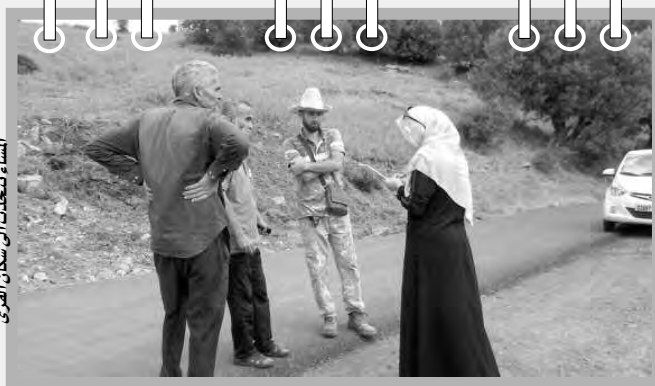
الساء تتحدث الى سكان القرى

مشرمة، خاصة "التين المبكر" أو التين، والهندي وكذا البرقوق والرمال والقليل من أشجار التفاح. وقال محدثا إنه من دشرة أولاد بلمو، التي شهدت هجرة جماعية لسكانها خلال سنوات الإرهاب، واليوم عاد معظم السكان. وقال إنه عاد إلى أرضه سنة 2011 قادما من بلدية بودواو، مؤكدا مشقة العمل في الأرض لغياب الكهرباء الريفية؛ حيث يضطر للعمل بمحرك بنزين لتوليد الطاقة. كما يضطر لقطع مسافات طويلة لجلب الماء بالصهرج، مناشدا الجهات المعنية النظر بعين الاعتبار لتوفيرهما؛