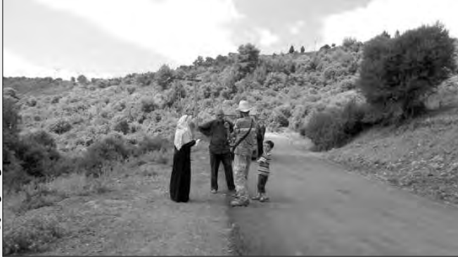
الساء تتحدث الى سكان القرى