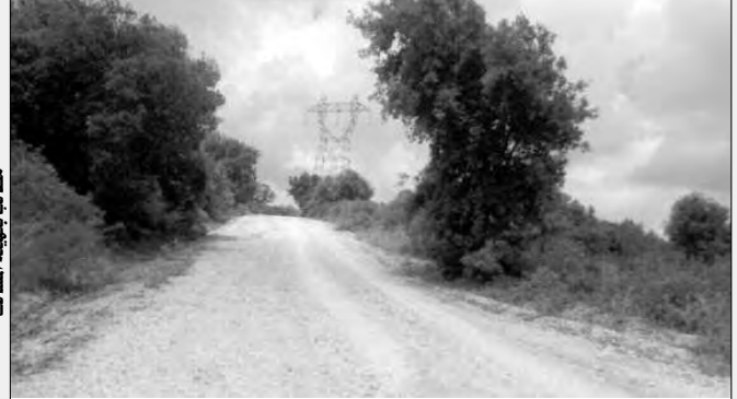
مطالب تهيئة المسالك

عاد العشرات من سكان القرى المتزامية بجبال بلدية عمال الواقعة بالجنوب الغربي لولاية بومرداس، لأراضيهم في السنوات الأخيرة بفضل استتباب الأمن، عادوا لخدمة أراضيهم التي هجروها سنوات المأساة الوطنية، بعضهم استقر في أرضه وحقق اكتفاء من الفلاحة الجبلية، بينما لا يزال الكثير منهم ينتظرون التفاتة السلطات لتحقيق مطالب توفير الكهرباء الريفية والمياه، وتهيئة شبكة التطهير، والمسالك، بما يمكنهم من بلوغ أراضيهم، والاستقرار الفعلي، مساهمة في تنمية الاقتصاد الوطني.