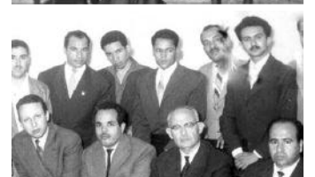
يقلم: الدكتور محيي الدين عميمور