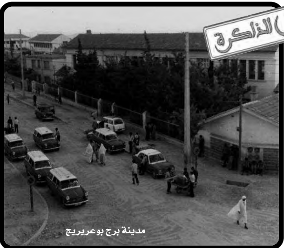
مدينة برج بوعريج