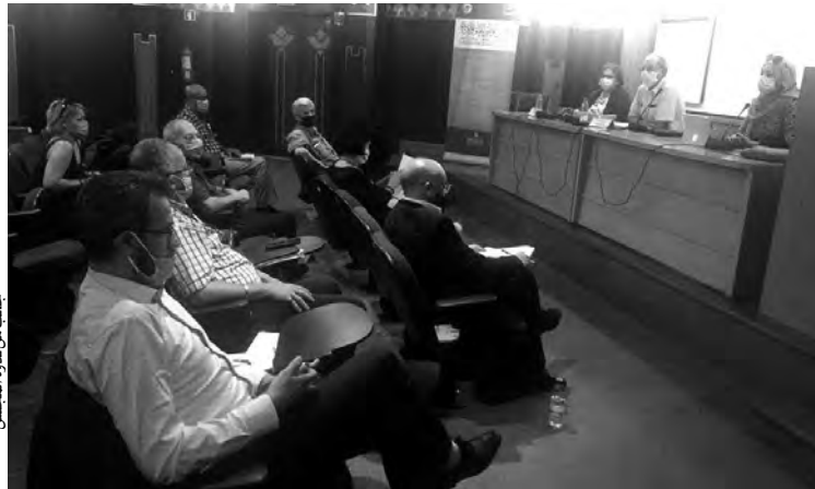
جلسات من ندوة المجلس

الذي يعرفه المجلس في السلفة الأمازيغية، سواء ما تعلق بدراسة الملفات ذات الصلة، أو مشروع ترجمة "لبيس المهن الفنية"، إلى اللغة الأمازيغية، فتم الاتفاق على ضرورة إضافة عضو مختص في اللغة الأمازيغية إلى المجلس، وعند الحاجة، الاستعانة بدوي الاختصاص من خارج المجلس، خاصة المحافظة العليا للغة الأمازيغية. تمت أيضا خلال هذه الجمعية العامة، مناقشة مشروع التمهيدي للمرسوم التنفيذي الذي يحدد النظام النوعي لعلاقات العمل المطبقة على الفنانين، بغرض الإسراع في وضع إطار منظم لفائدة الفنان، وريعا للوقت والجهد. يهدف هذا المشروع إلى وضع قانون تطبيقي لعلاقات عمل الفنانين، مع ضبط مهنة الفنان وأصناف الفنانين، وهو يشبه إلى حد بعيد ما يمكن أن يتضمنه "قانون الفنان والمهن الفنية"، إلا أن ميزة هذه الصيغة القانونية هي سرعتها في الصدور والتفويض. اتفق المجلس بالأغلبية على ضرورة الذهاب إلى اعتماد مشروع مرسوم تنفيذي، خير من اعتماد صيغة "قانون الفنان" الذي سيحتاج إلى ترسانة قانونية، بعضها غير موجود، ووقت