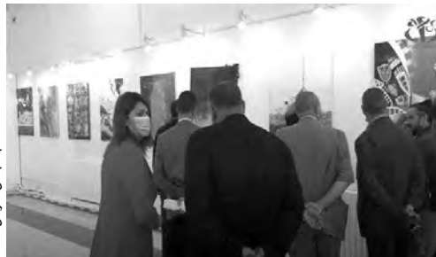
الكتب من معرض خنشلة