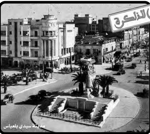
مدينة سيدي بلعباس