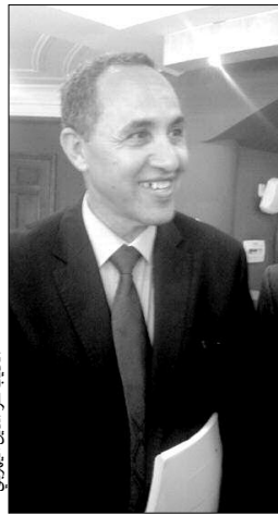
عز الدين ميهوبي، الوزير السابق، السيد عز الدين ميهوبي، عن تناوله بمستقبل اللغة العربية في الجزائر، من خلال هذا الحوار الذي خص به "المساء"، حيث توقف عند عدد من المسائل التي تهم لغة الضاد.

♦♦ نعتز كل الاعتزاز بظهور أسماء جديدة في المشهد الثقافي الإبداعي الجزائري، تجاوزت حدود الوطن بعد أن تمكنت من فرض نفسها