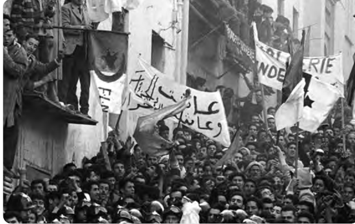
كريكو: المرأة الجزائرية لعبت دورا هاما في المظاهرات التاريخية

من جهتها أكدت وزيرة التضامن والأسرة وقضايا المرأة، كوثر كريكو، أمس، بخنشلة، على الدور الهام الذي لعبته المرأة الجزائرية في مظاهرات 11 ديسمبر 1960، داعية خلال الكلمة التي ألقاها على هامش افتتاح الندوة التاريخية "11 ديسمبر 1960: مظاهرات وانتصارات، إلى إحياء بطولات النساء الجزائريات اللواتي أثبتن من خلال مشاركتهن في تأطير وتنظيم المظاهرات، وعيبن بحق الجزائر والجزائريين في تقرير مصيرهم". وكررت الوزيرة بأن تاريخ 11 ديسمبر 1960 "شكل محطة هامة في تاريخ الثورة المجيدة أثبتت فيه المرأة وقوفها إلى جانب شقيقها الرجل وثباتها على قرار واحد وموحد وهو الاستقلال لا غير". وعبرت خلال الكلمة على تضحيات بطلات الجزائر، داعية والتضحية من أجل بناء صرح مؤسساتي للدولة مثلما ضحت رفيقات زهور ونيسى من أجل أن تحيا الجزائر حرة مستقلة. كما أكدت على بصمة المرأة الجزائرية التي يضرب بها المثل في النضال القيادي وحضورها اللافت في الحركة الوطنية ومساهمتها في صنع انتصار الفاتح نوفمبر وتشارك في تدويل القضية الجزائرية بالأمام المتحدة وتكون اليوم مدعوة لاستكمال مسيرة البناء والتشييد. وحيث وزيرة التضامن والأسرة وقضايا المرأة مهنيات القطاع الصحي وقطاع التضامن ممن سمنتهن بـ "مجاهدات اليوم اللواتي جسدن فطرة الجزائريين في الانتماء من أجل محاربة جائحة كورونا".