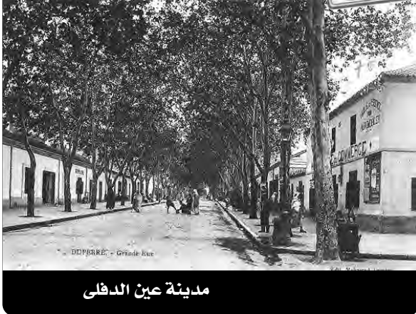
مدينة عين الدفلى