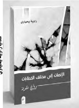
كتاب راوية يحيوي

أكدت الناقدة والشاعرة الجزائرية راوية يحيوي، في كتابها الجديد "الانصات لخطابات"، على أنها تنصت منذ ثلاثة عقود إلى "مختلف الخطابات الأدبية في إمكاناتها الإبداعية وفي تحولاتها، وأيضا إلى الخطاب النقدي في طاقاته العارفة، ورهاناته المغامرة في التحول، وهي تمر من تصحيح المسار إلى اقتراح البدائل".