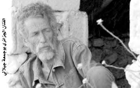
الفنان الجزائري بوجمعة جيلالي