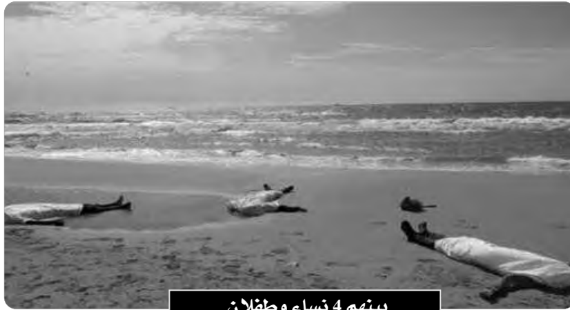
بينهم 4 نساء وظفان

تدخلت، أول أمس، مصالح الحماية المدنية بعباية بالتنسيق مع الوحدة الجبرية والوحدة الرئيسية واد الضية على مستوى المنطقة الصخرية عين بن سلطان، لانتشال جثة من البحر تعود لرجل في العقد الثالث من العمر. وبعد إتمام الإجراءات القانونية تم نقله إلى مصلحة حفظ الجثث بمستشفى ابن سينا الجامعي. سيرة عوام