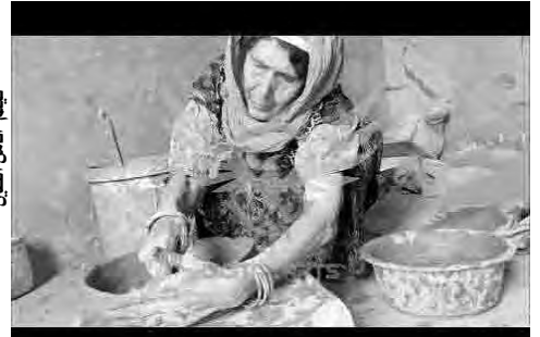
فيلم "أنامل الطين"