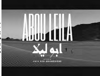
الفيلم الروائي "أبو ليلى"