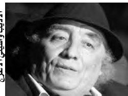
الأديب واسيني الأبرج