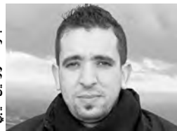
الأديب واسيني الأبرج