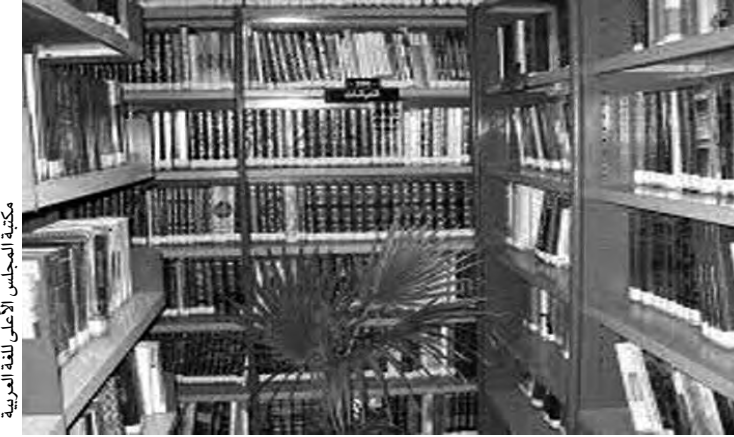
مكتبة المجلس الأعلى للغة العربية

يحمل مشروع الاستكتاب الوطني 54 مسألة لغوية تحتاج إلى علاج من قبل المختصين: تبريكاً بسنة 54، التي عملت على التغيير، وأحدثت نقطة تحول في الذهن الجزائري، وحصل تغيير فكري، أدى إلى ثورة عارمة، مكنت من الانتصار. وهذا الاكتتاب رافداً من روافد الجزائر الجديدة التي حملت 54 تعهداً للرئيس تبون، الذي تعهد بإحداث القطيعة مع كل أشكال التراخي، وصولاً إلى صناعة أجيال معاصرة، تحمل الهوية الثقافية على عاتقها وتسير مع العداة، معادها الإسلام والعربية والأمازيغية؛ ثلاثية متقاطعة ومنسجمة. وأشار المجلس إلى أن المداخلات ستطبع على حساباته ضمن كتاب جماعي بعنوان "اللغة العربية في الجزائر منجزات وروايات".