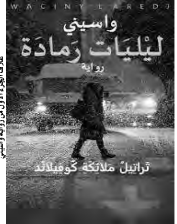
غلاف الجزء الأول من رواية واسيني

والترم واسيني بالرد على جميع التعليقات. وأضاف أنه بدأ رفقة قرائه في هذه التجربة، وفي هذا السياق، نشر فصلين في الأسبوع، يومي الخميس والأحد، في مارس 2020، وكانت المفاجأة مذهلة. أكبر بكثير من أفق انتظاره. كما اتخذ نشر الفصول مدارات جديدة، ليتحول النقاش بالفعل إلى محاورات حقيقية، بمستويات مختلفة، كأنهم في ورشة حية، موضوعها رواية هم شركاء في ميلادها بشكل ما من الأشكال.