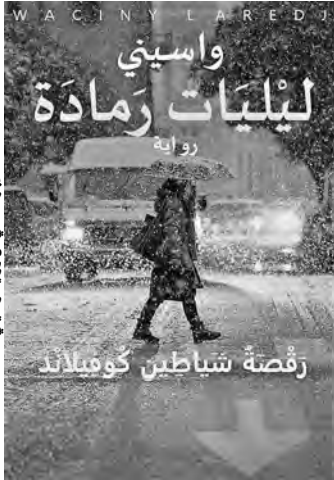
غلاف الجزء الثاني من رواية واسيني