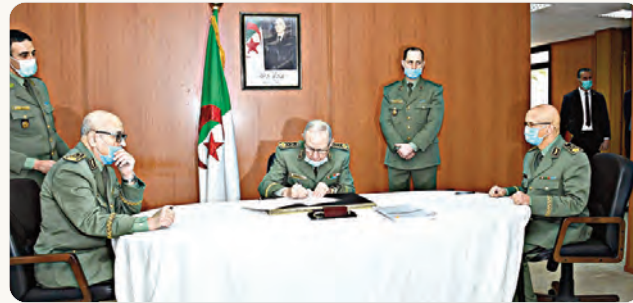
مقري، مديرا عاما للوثائق والأمن الخارجي خلفا للواء محمد بوزيت. وأسدي رئيس أركان الجيش الوطني الشعبي، لإطارات هذه المديرية "جملة من التعليمات والتوجيهات بغية مواصلة بذل المزيد من الجهود في خدمة الجزائر وحماية مصالحها العليا"، حاثا إياهم

« مواصلة بذل المزيد من الجهود في خدمة الجزائر وحماية مصالحها العليا