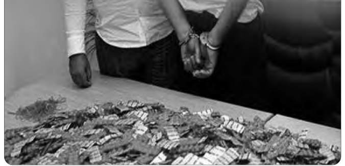
مركبة، مقابل 135 سيارة مسروقة.