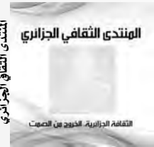
المنتدى الثقافي الجزائري

وكشف العشي عن وجود علاقات مع مثقفين وأكاديميين جزائريين من المشرق العربي وأوروبا وكندا وأمريكا، وقد تمت في الأسابيع المقبلة، لينتقل إلى مسألة تأثير التدفق البطيء للأنترنت على نشاطات المنتدى، والتدفق البطيء للأنترنت وعطل بشكل كلي ندوة من ندواتنا، واستعنا بالهاتف لإتمامها.