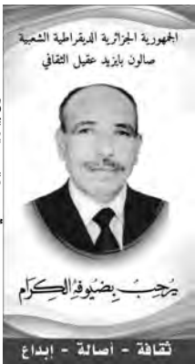
صالون بيازيد عقيل الثقافي

التحكيم وجائزة الجمهور، وتوزع دروع المسابقة في جلسة من جلسات "صالون بيازيد عقيل الثقافي".