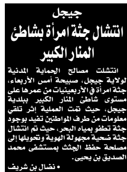
قتل امرأة بشاطئ المنار الكبير

انتشلت مصالح الحماية المدنية لولاية جيجل، صبيحة أمس الأربعاء، جثة امرأة في الأربعينيات من عمرها على مستوى شاطئ المنار الكبير ببلدية جيجل، حيث تمت العملية إثر تلقي معلومات من طرف المواطنين تفيد بوجود جثة تشبه جثة امرأة البحر، حيث تم انتشال جثة ضحية مجهولة الهوية وتحويلها إلى مصلحة حفظ الجثث بمستشفى محمد الصديق بن يحيى.