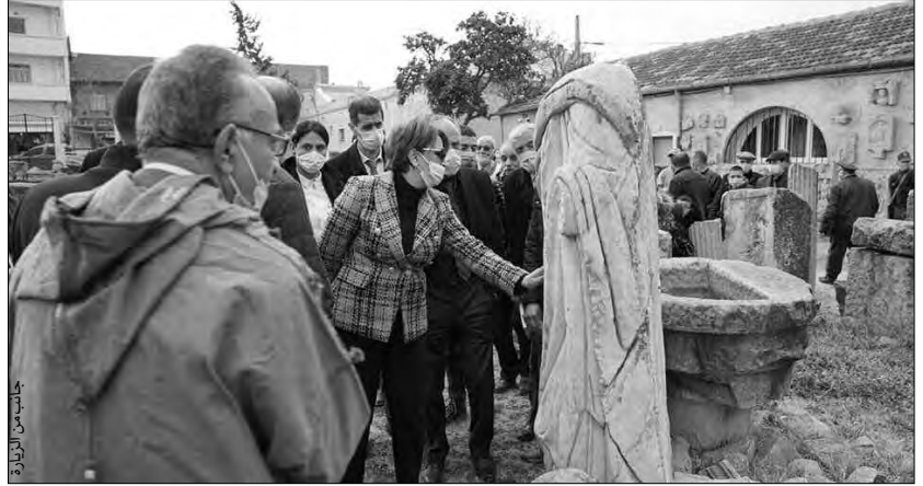
جانب من الزيارة

ودامت زيارة الوزير لباتنة يومين كاملين، وتأتي في إطار متابعة مختلف المشاريع، والإطلاع على وضعية القطاع بهذه الولاية. كما وقفت السيدة الوزيرة على مدى تقدم أشغال إنجاز بعض المشاريع التنموية والمنشآت التابعة لقطاع الثقافة والفنون، وعابرت بعض المؤسسات، ومدى مردوديتها ومسايرتها لمتطلبات سكان الولاية، خصوصا بمناطق الظل؛ حيث أشرفت على وضع حيز الخدمة، مشروع تزويد سكان منطقة الحظ بتيبشرين وأفرار والرقادة بدائرة أريس، بالطاقة الكهربائية، ومشروع تزويد بالغاز لفائدة 11 عائلة، وضعت حيز الخدمة، شبكة الغاز بأولاد بوكعاز بدائرة كوكوت. كما أشرفت الوزيرة على إطلاق اسم عيسى جرموني على المعهد الجهوي للتكوين الموسيقي، واسم محمد بومداغ على المدرسة الجهوية للفنون الجميلة، إضافة إلى تدشين سينماتيك الأوراس التي خضعت لعمليات تأهيل. وعابرت الوزيرة المسرح الجهوي، والتقت المثقفين والفنانين وممثلي المجتمع المدني بباتنة. واستمعت بتكريم باحثين وفنانيين.