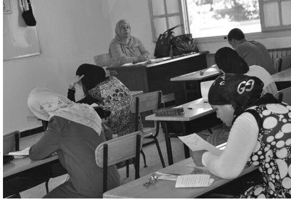
صورة من الأرشيف