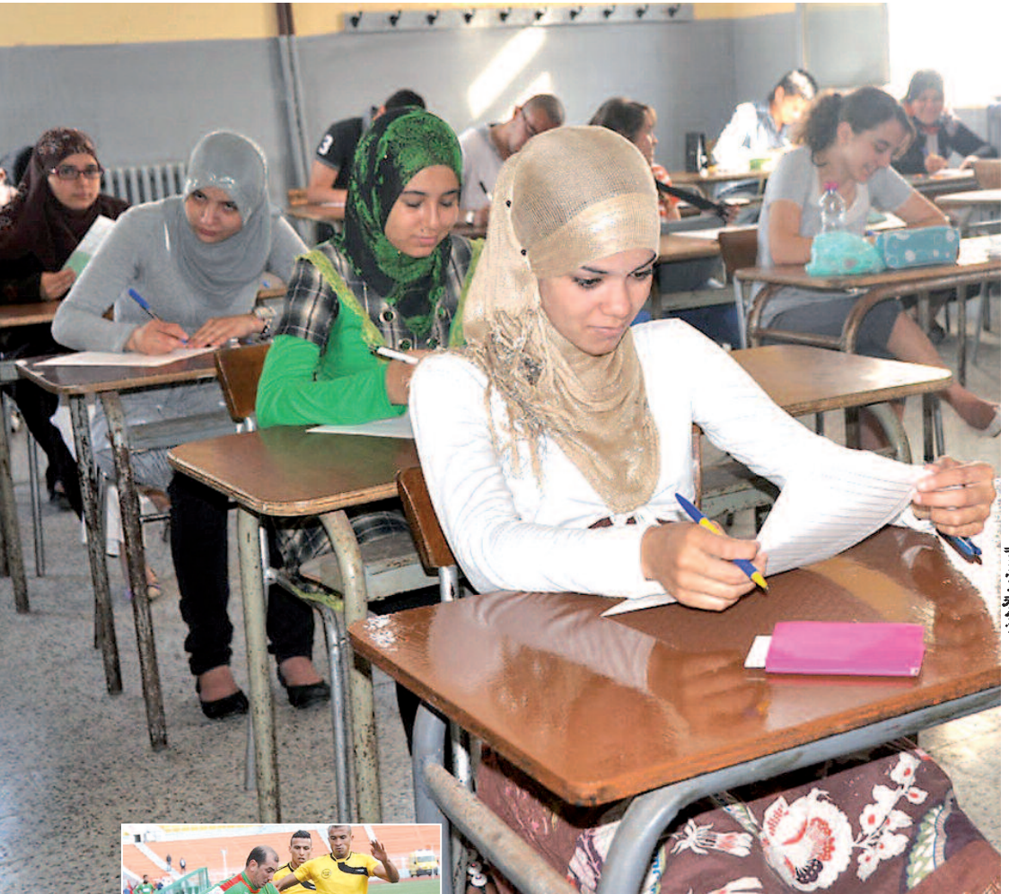
السورة من الأرشيف

أعلن الديوان الوطني للامتحانات والمسابقات "أوناك"، عن جملة من التدابير التي من شأنها منع الغش في امتحان شهادة البكالوريا دورة جوان 2014، وبغرض القضاء على الظاهرة التي تزايدت في السنوات الأخيرة، لاسيما خلال بكالوريا دورة جوان 2013، التي سجلت خلالها حالات غش جماعية ببعض أقسام الامتحان أدت إلى تسليط عقوبات صارمة على عدد من المترشحين المتورطين، أدرج الديوان في وثيقة تم نشرها مؤخراً، بعض الإجراءات التي تعتمد لأول مرة في امتحان البكالوريا.