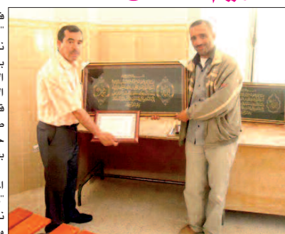
كرمت جمعية "أصدقاء البيئة" لبلدية الشفة مؤخرا، ثلاثة مديري مدارس ابتدائية