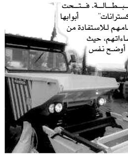
السيارة التي تقوم بتنظيف الشوارع

أوضح السيد مشاب أن هدف مخطط النظافة الذي سطرته مؤسسة "اكسترنات"، يتمحور حول الاستمرارية والعمل على المدى البعيد للحفاظ على المحيط والبيئة، مشيراً إلى أن الطاقم الذي يشرف على المؤسسة يبذل مجهودات جبارة في سبيل تحقيق الاستمرارية، من خلال فتح أبواب الحوار مع المواطن الذي يساهم بدرجة كبيرة في نجاح المشروع، من خلال ترسيخ فكرة "النظافة" في الأذهان، ليصبح المواطن بذلك غيوراً على محيطه بصفة تلقائية.