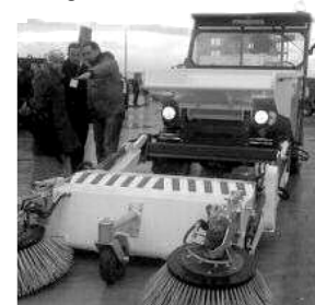
السيارة التي تقوم بتنظيف الشوارع

للمحملات التحسيسية التي تقوم بها "اكسترنات"، حيث لاحظ عمال المؤسسة أن المواطن لفت انتباهه العتاد الجديد الذي تستعمله المؤسسة في خرجاتها الميدانية، إلى جانب الزي الجديد لشاحنتها رفع القمامة، وأصبحت لنظافة المحيط أهمية كبيرة في أوساط المجتمع مقارنة بما مضى.