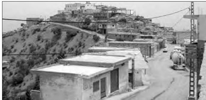
زيتا أكثر عذوبة ونكهة.