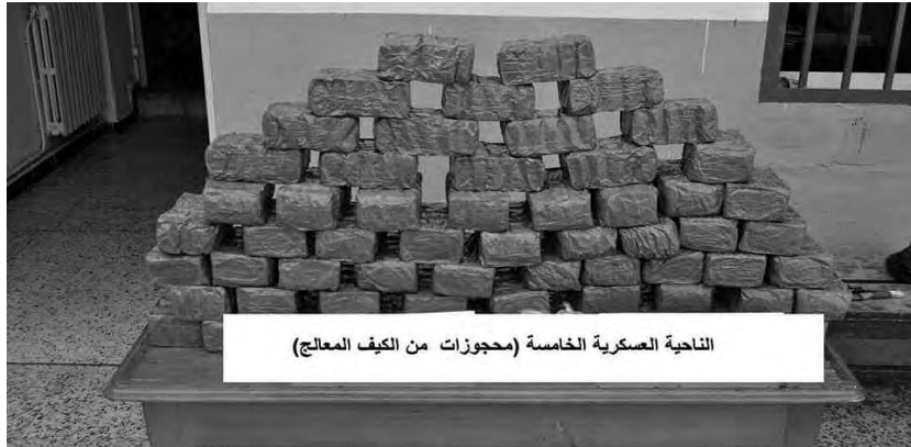
الناحية العسكرية الخامسة (محجوزات من الكيف المعالج)

وسجلت الوحدات خلال السنة المنقضية، معالجة 213 قضية تتعلق بالألتجار غير الشرعي بالمخدرات والمؤثرات العقلية، وتوقيف 215 مشتبها فيه، مقابل 196 قضية عولجت في نفس الإطار، خلال السنة التي سبقتها 2019، توبع بشأنها 232 موقوف، كما ورد في الحصيلة. ق. م