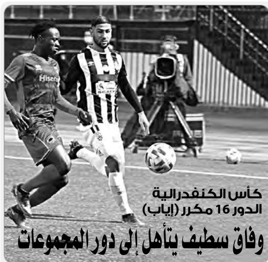
حأس الكنفدرالية الدور 16 مكرر (إياب)