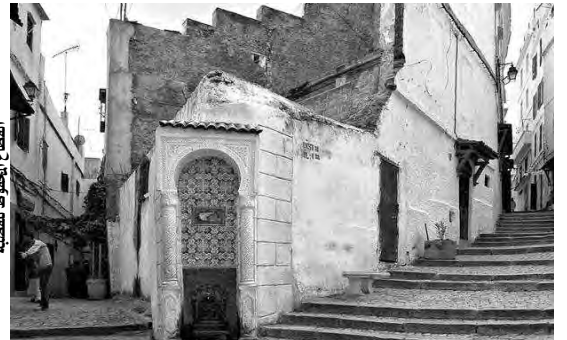
القطاع المحفوظ للقصبة

استعرض المتحدث، خلال يوم دراسي بمركز الفنون والثقافة لقصر "رياس البحر" بالجزائر العاصمة، نظم في إطار إحياء اليوم الوطني للقصبة المصادف 23 فبراير، أهم القوانين التي تخص تصنيف القطاع المحفوظ بقصبة الجزائر، بداية من اقتراح تصنيفها كتراث وطني سنة 1973، ثم تصنيفها كتراث التراث الإنساني العالمي من طرف "اليونسكو" سنة 1992، إلى جانب استحداث وتحديد القطاع المحفوظ سنة 2005، وبعدها انطلاق الأشغال الاستعمالية عام 2008، وصولا إلى المصادقة على المخطط الدائم للحفظ واستصلاح القطاع المحفوظ 2012. أوضح المصدر، أن قصبة الجزائر تعتبر مثالا فريدا للعمارة التقليدية الإنسانية، فهي تمثل الثقافة الإسلامية ذات البعد المتوسطي، وتمازج العديد من التقاليد، وتضم آثار القلعة والمساجد القديمة القصور العثمانية، بالإضافة إلى البنية العمرانية التقليدية المتجانسة. ذكر بخصوص مهام الوكالة الوطنية للقطاعات المحفوظة، أنها تقوم