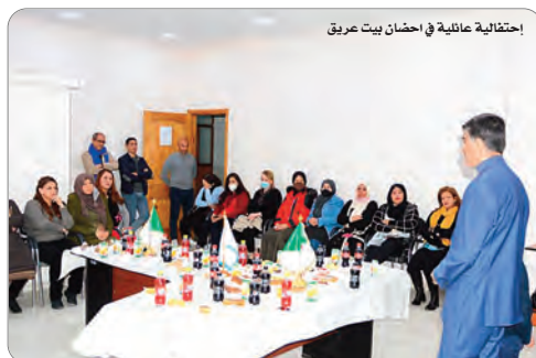
إحتفالية عائلية في احضان بيت عريق

التكبير الإيجابي والعائلي "الكفاح" بنض الرجل الواحد - قال المدير العام - هو من بين ما يمكن الاعتماد عليه لبناء المؤسسات الناجحة، مع المزج بين العلاقات الإنسانية والمهنية بخلطة