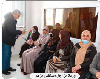
وردة من أجل مستقبل مزره