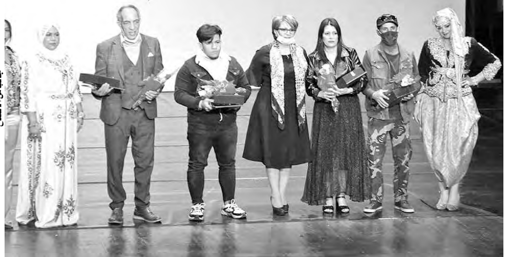
جانب من الافتتاح

جرى حفل الافتتاح الرسمي للمهرجان الوطني 14 للمسرح المحترف، مساء الخميس المنصرم، في ظروف جيدة، التزام فيها الحاضرون بتعليمات الوقاية؛ تقاديا لانتشار وباء كورونا، وبحضور وزيرة الثقافة والفنون مليكة بن دودة، التي أعلنت في كلمتها الافتتاحية، عن تخصيص يوم وطني للمسرح الجزائري، يصادف 8 جانفي، وهو تاريخ يصادف يوم تأميم المسرح الوطني عام 1963. دليلا مالك